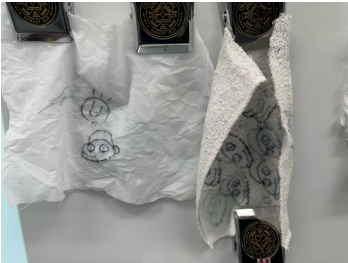
油性ペン汚れはなかなか落ちない

(共学共高とは：本校のディプロマポリシー（育てたい生徒像）の一つで、「共に学び、共に高め合う」生徒の姿を表す)